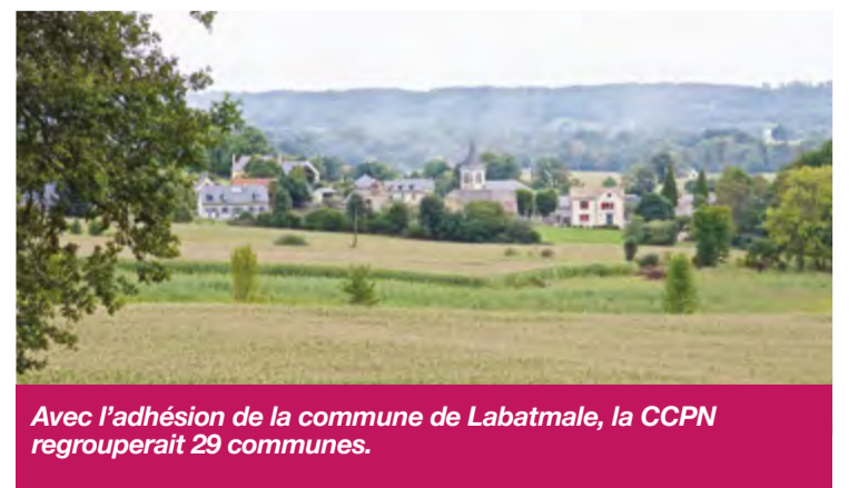
Avec l'adhésion de la commune de Labatmale, la CCPN regrouperait 29 communes.

de travail de la CCPN. Tel avait également été le cas pour les communes d'Arbéost, d'Assat, de Ferrières et de Narcastet, au cours des années 2012-2016.