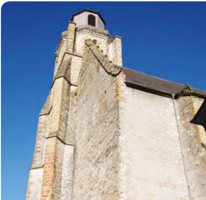
La réfection de la toiture de l'église Saint-Vincent à Nay est prise en compte dans les chantiers de restauration.

La protection, la restauration et la mise en valeur du patrimoine rural et religieux non protégé sont essentielles. Après un recensement, une série d'actions a été engagée par la CCPN pour la mise en valeur du patrimoine des communes et le soutien à des initiatives privées.