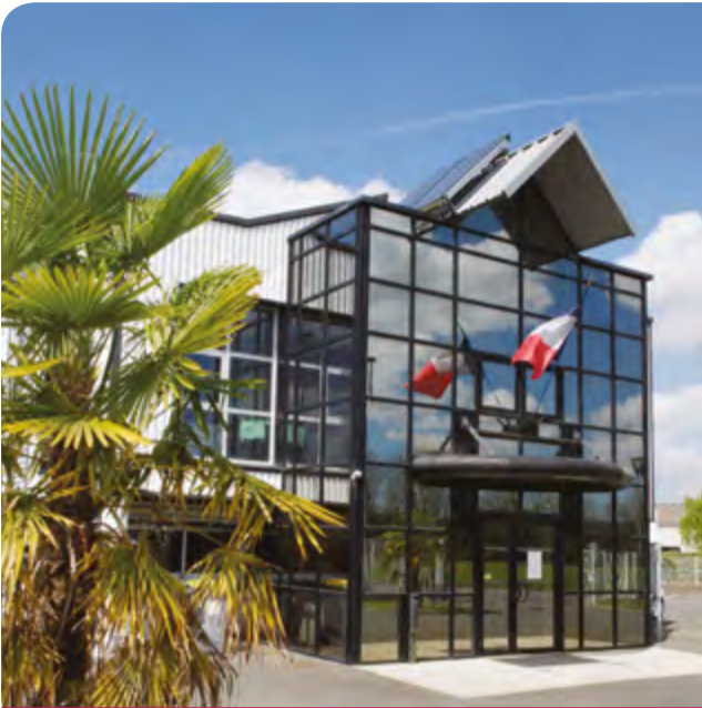
À Bénéjacq, le siège de la CCPN regroupe les services et accueille les réunions des différentes instances.